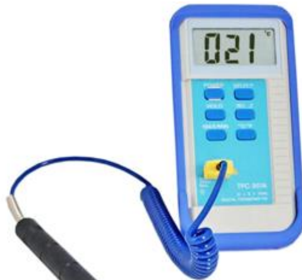
K、J、E、T Type 多類型熱電偶溫度計 型號: TFC-307A