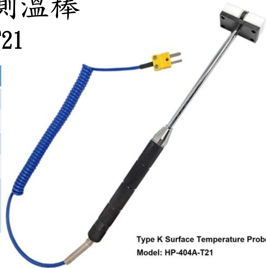
Type K Surface Temperature Probe Model: HP-404A-T21